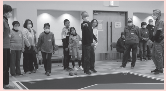
世代間交流 社協交流会の様子

詳細については、6月に自治会・町内会に配布する回覧物やホームページをご覧ください。