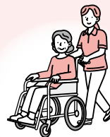
医療・介護の問題