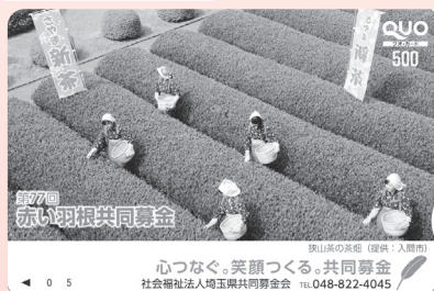
▲狭山茶の茶畑