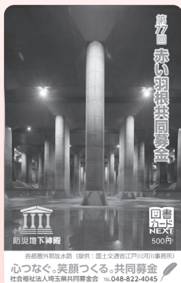
▲首都圏外郭放水路

初音ミクを通じてクリエイターの皆さんが赤い羽根共同募金を応援しています。200円以上の募金額でクリアファイル、500円以上の募金額でピンバッジを差し上げます。