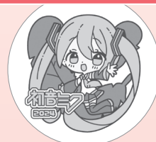
Art by さんご。©CFM