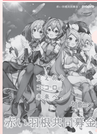
Art by さざなみ©CFM