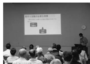
新任研修会の様子

身近な地域の困りごとを早期に発見するために、日常적인見守りを行う「福祉見守り員」が活動しています。ちょっとした変化を発見した場合は、民生委員・児童委員や社会福祉協議会につながります。