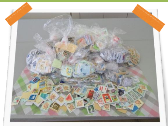
3日間の古切手整理の完成品