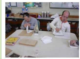
手すきハガキ製作の様子