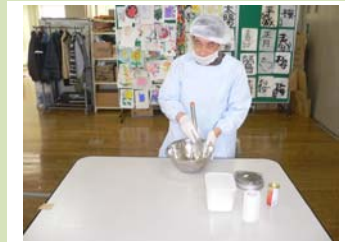
クッキー製作の様子