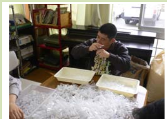
もぎとり作業の様子