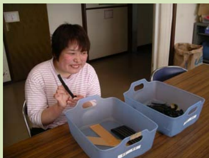
ゴムバリ取り作業の様子