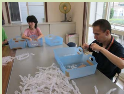
もぎり作業の様子