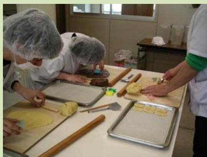
クッキー製造の様子